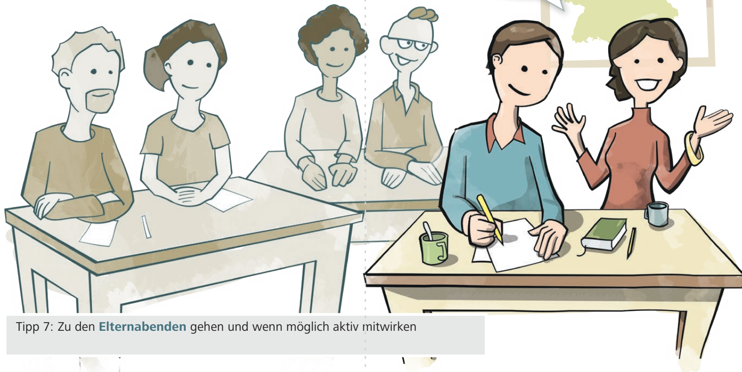
Tipp 7: Zu den Elternabenden gehen und wenn möglich aktiv mitwirken