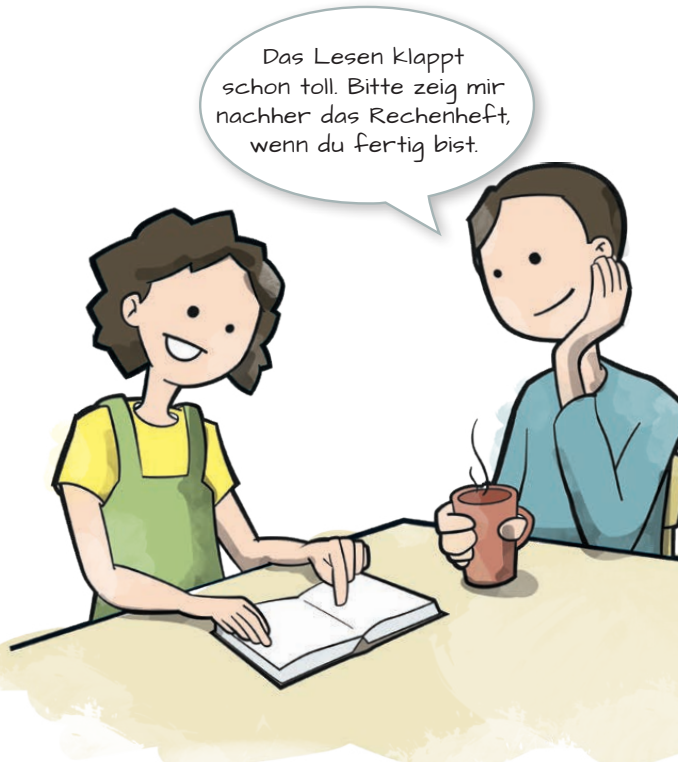
Tipp 3: Kontrollieren, ob die Hausaufgaben gemacht sind, und bei Bedarf helfen