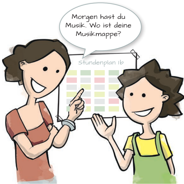
Tipp 1: Auf den Stundenplan schauen und dabei auf die Fächer achten