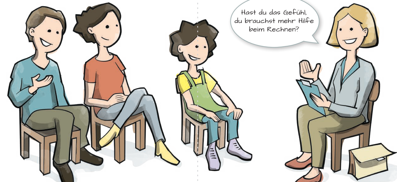
Tipp 10: Nach Mitteilungen der Schule fragen, sie lesen und Aufforderungen nachkommen

Hast du das Gefühl, du brauchst mehr Hilfe beim Rechnen?