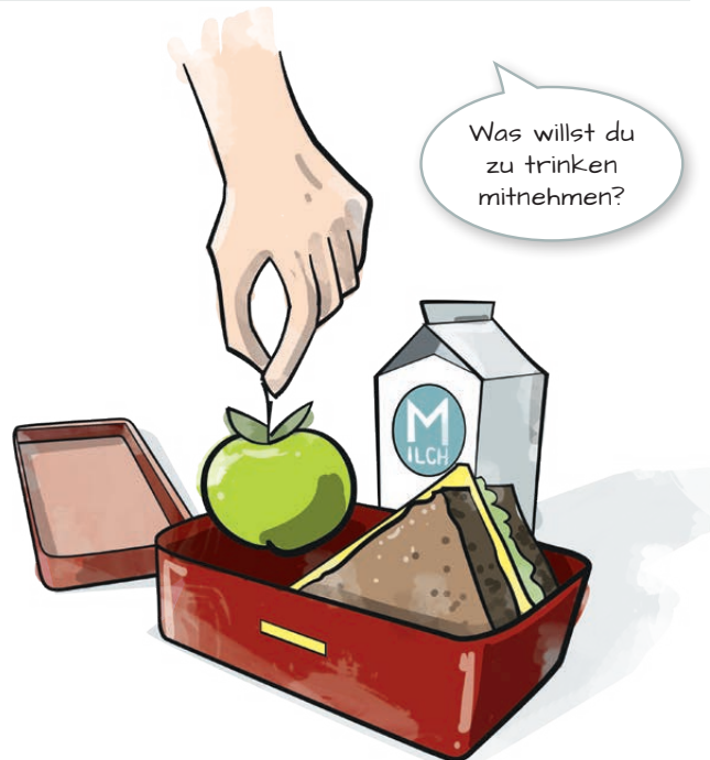
Tipp 2: Gesundes Essen und Getränke für die Pause mitgeben