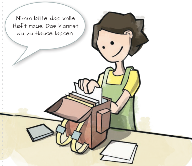
Tipp 5: Den Schulranzen mit dem Kind in Ordnung halten